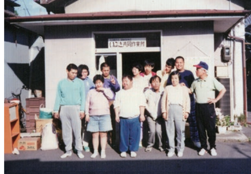
無認可時代いぶき共同作業所にて