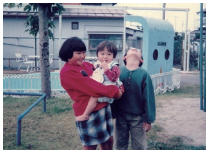
おねえちゃんおにいちゃんと

初めて聞く病名に、私たち夫婦は頭が真っ白になりました。先生から丁寧に説明を受け、理解しようと努めました。「自分の子に限って」という思いが強く、なかなか受け入れることができませんでした。処方された薬を飲み続けることで、幸いにもそ