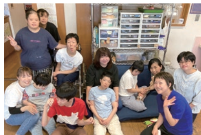
岐阜県美術館のショップスタッフのおふたりが来てくれました