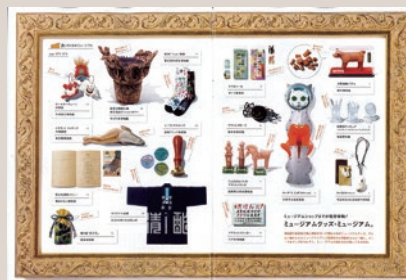
2025年1月10日発売 雑誌「BRUTUS(ブルーラス)」

オディロン・ルドンの《蜘蛛》をモチーフにした「くもくんブローチ」が掲載されました。通いたくなるミュージアム、ミュージアムグッズ特集にて紹介いただきました。購入は、岐阜県美術館ナンヤローネSHOPにて。