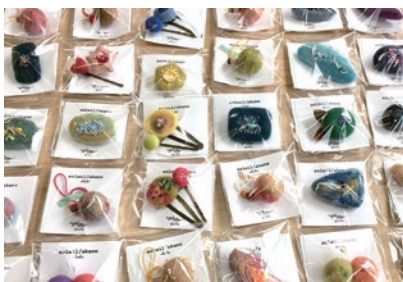
いろいろな色やかたち、アイテムも豊富です

毎年岐阜駅で開催されるクラフトフェアに出展したとき、私たちの心に残る出来事がありました。お客様が「軽くていいわね、これなら肩が凝らずに毎日つけられる」と喜んでくださったのです。