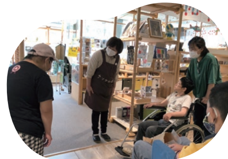
岐阜県美術館のショップへ納品。「よろしくおねがいします」

間の個性と、支えてくださる皆さまの想いが重なって、いぶきの物語は紡がれていきます。これからも、手仕事の温かみとともに、仲間たちの輝きを届けていきます。どうぞ、いぶきの羊毛フェルト活動と一緒に楽しんでもらえたらうれしいです。