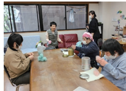
羊毛フェルトの仕事風景

見ている仲間もいます。私たちは無理に声をかけることはしません。楽しそうな空気を感じて、その人がふと近づいてきた時が「やり時」です。やらされるのではなく、自然と関わりたくなる場をつくること。それが、いぶきのフェルト仕事の土台になっています。