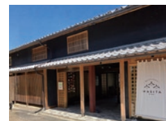
シェアオフィス WASITA MINO内 総合在宅医療クリニックみの かがやきベンチ

ケアは専門職だけが担うものではありません。人と人、モノ、場所のあいだに、すでにケアの種は宿っています。かがやきベンチはまちの人たちとともに、その種をみつけて、つなげて、足りないものはつくる「ケアを編みなおす」拠点として、「なんとかなるさ」と思える人が一人でも増えていくことを目指しています。