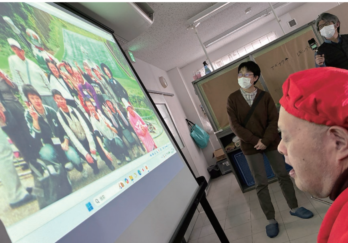
還暦を祝う会で、懐かしい写真をみんなでみました