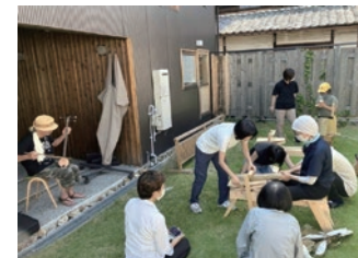
ベンチづくりプロジェクトの風景

「ベンチ」には、年齢も立場も関係なく、誰もが横並びで座れる—そんな余白のある場所でありたいという願いを込めています。わたしが在宅医療の現場で日々感じるのは、ケアは専門職が提供するものはごく一部で、大部分はその人自身や家族、家やまちの中にあるモノや場所など、日常の中に埋め込まれているということです。訪問診療でお伺いしていたある方が、「もう一度、行きつけの喫茶店でモーニングが食べたい」と希望されました。肺の病気で外出を諦めていたのですが、ご家族とスタッフで計画を立て、一緒に出かけることができました。顔なじみの店主と言葉を交わし、いつもの席で、普段は少食なのにモーニングをほぼ完食されました。この時間が、その方にとって「自分らしい暮らし」を取り戻すきっかけになりました。ケアの力を発