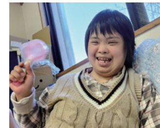
楽しくふりふりしています

ねこ玉（フェルトボールのストラップ）は、当初から現在に至るまで大切に作り続けている仕事です。21mmで真球に近いねこ玉がきれいに並んだ姿は、とても美しく、いぶきの象徴的な商品の一つです。一方で、制作の過程ではどうしても真球にならないものも生まれます。それらを「すべて不良品としてしまうのはもったいない」そんな思いが広がりました。