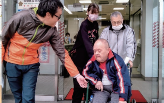
注文いただいた商品のお届けに